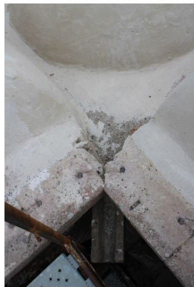
Εικ. 7, 8 Απόψεις προέχουσας λαξευτής υδρορρόης που βρίσκεται κάτω από το γείσο.