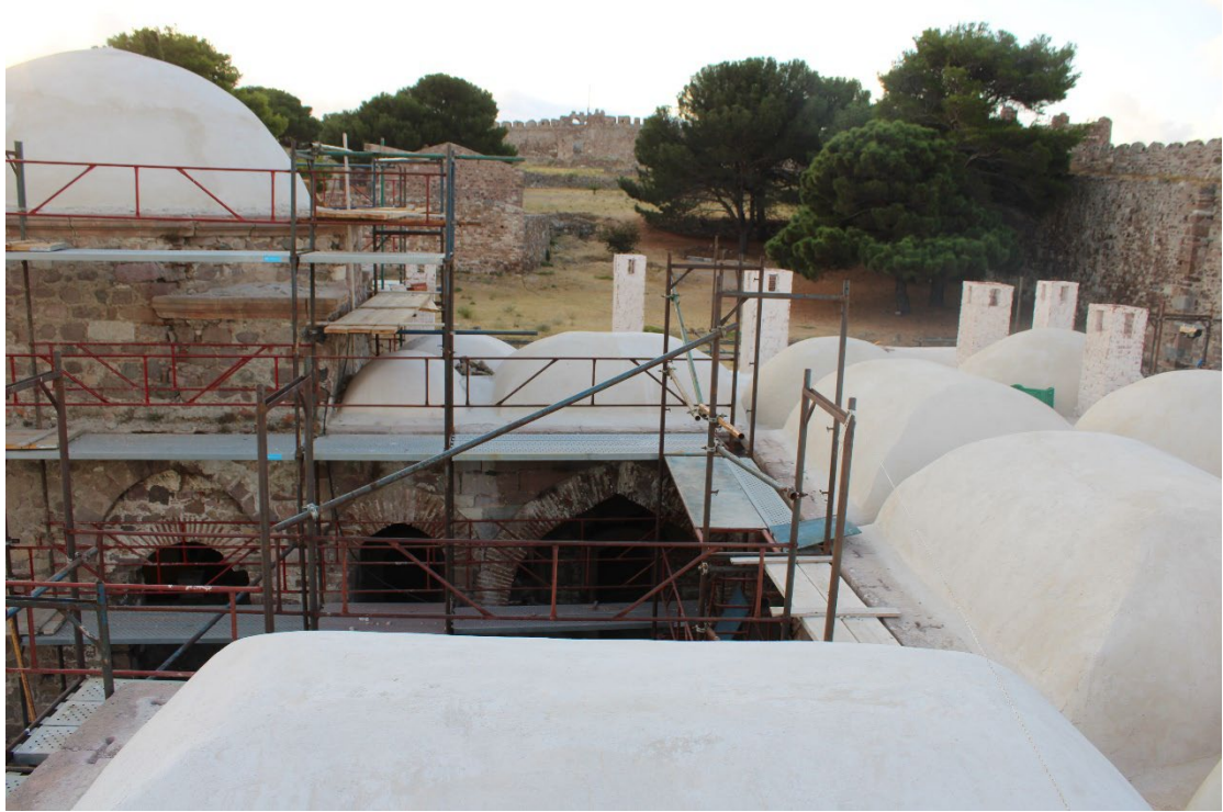
Εικ. 3 Γενική άποψη της υφιστάμενης κατάστασης της θολοδομίας του κτηρίου, μετά την ολοκλήρωση των εργασιών εξυγίανσης των εξωραχίων. Άποψη από τα ΒΔ.