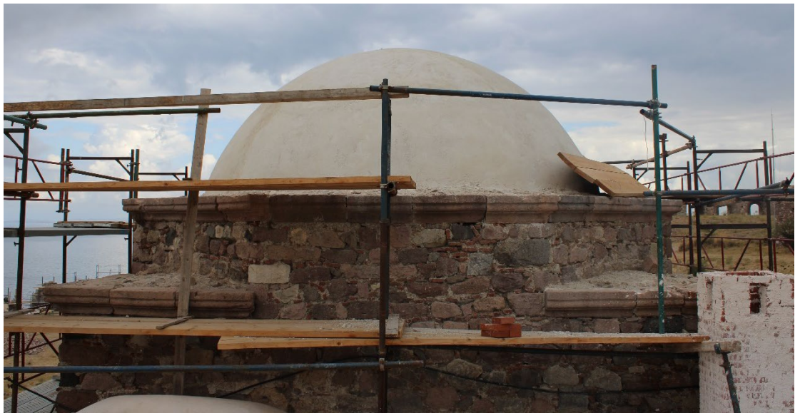
Εικ. 1, 2 Απόψεις της υφιστάμενης κατάστασης του τρούλου της αίθουσας προσευχής