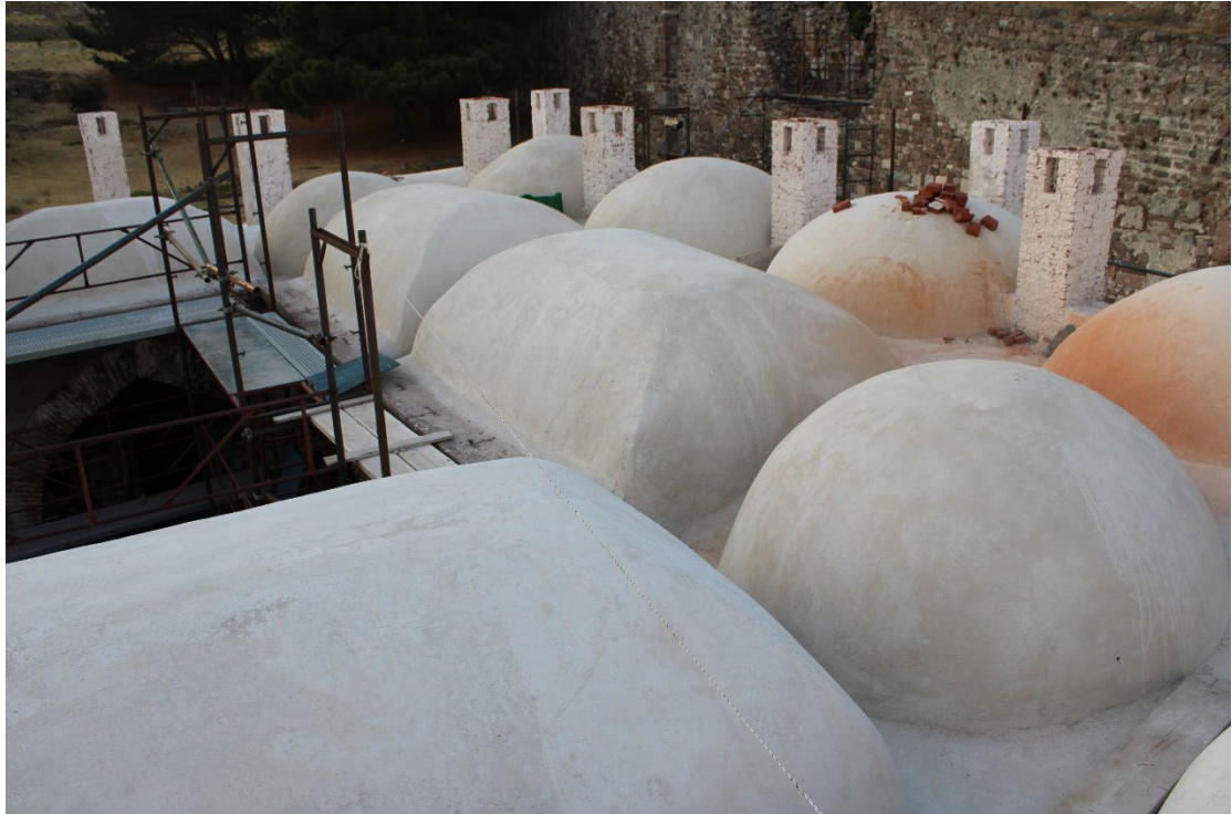
Εικ. 4 Γενική άποψη της υφιστάμενης κατάστασης της θολοδομίας του κτηρίου, μετά την ολοκλήρωση των εργασιών εξυγίανσης των εξωραχίων. Άποψη από τα βόρεια.