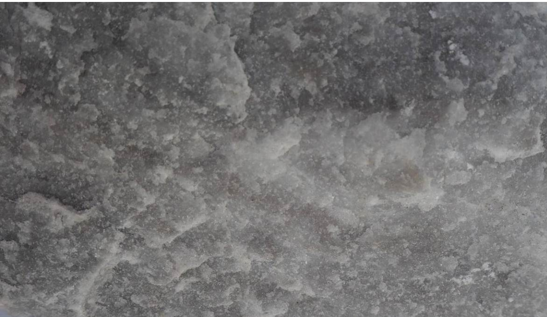
Εικ. Β2 Λεπτομέρεια επιφάνειας ακατέργαστου θραύσματος από γκρίζο μάρμαρο από το λατομείο της Πηγής Λέσβου που προσομοιάζει μακροσκοπικά με τα μάρμαρα που έχουν χρησιμοποιηθεί στο Κάστρο Μυτιλήνης.