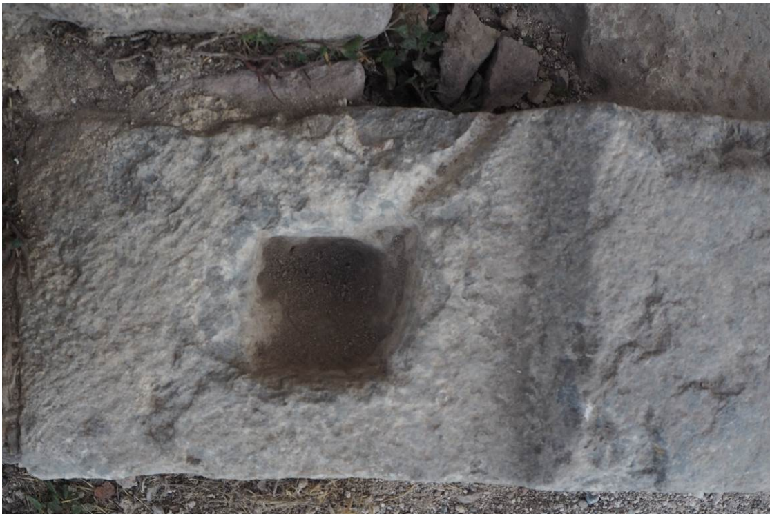
Εικ. Β8 Κατώφλι αυλόθυρας. Λοξότμητη απότμηση για την προσαρμογή της αριστερής παραστάδας του πλαισίου που φέρει εντορμία ορθογωνικής διατομής για τη σύνδεση των μελών.