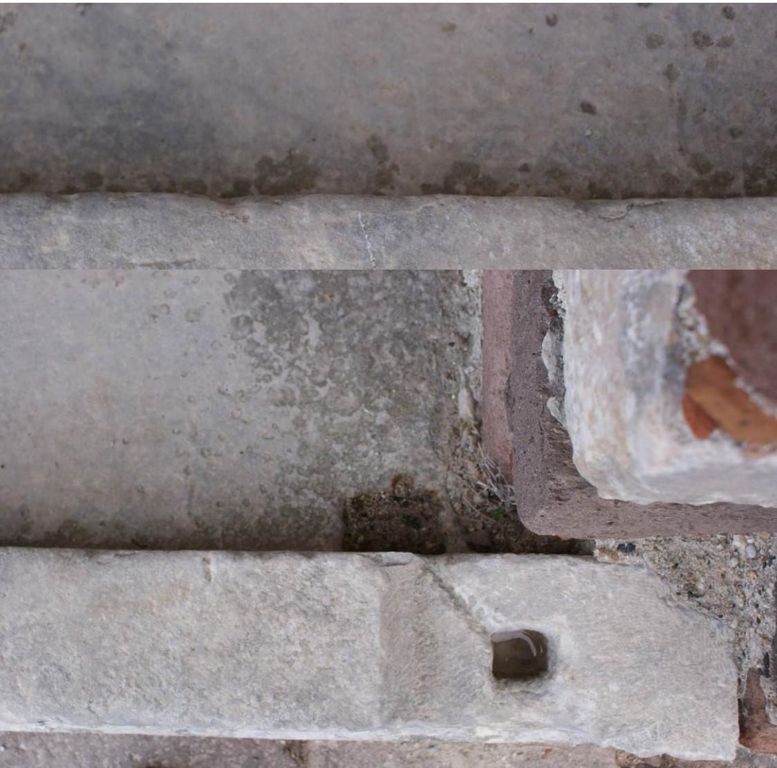
Εικ. Β5 Το μαρμάρινο κατώφλι της εισόδου στην αίθουσα προσευχής. Λεπτομέρεια τελικής