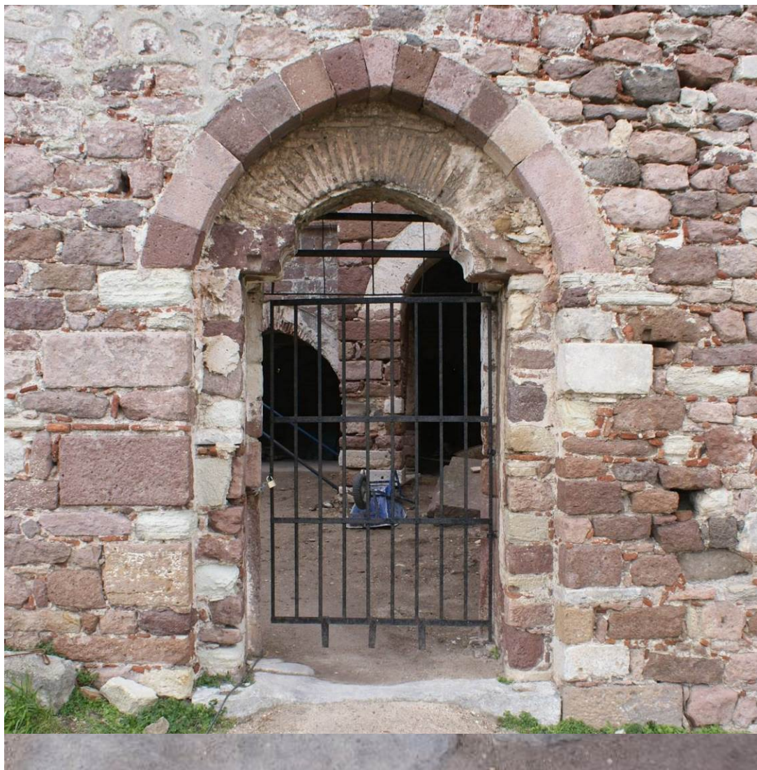
Εικ. Β9-Β10 Αυλόθυρα Οθωμανικού Ιεροδιδασκαλείου. Διατηρείται το κατώφλι από γκρίζο