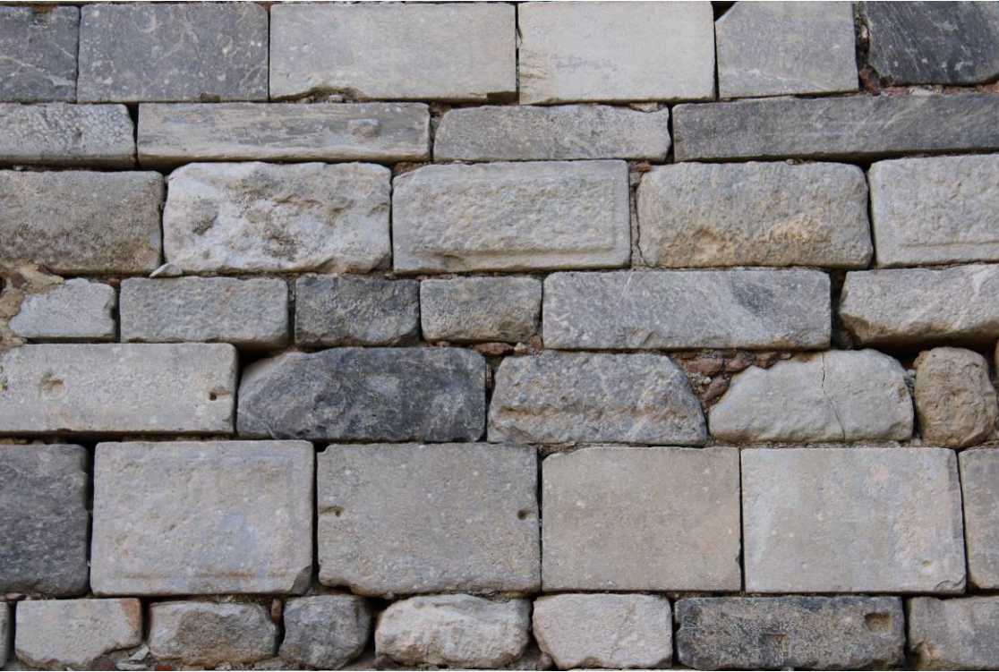
Εικ. Β1 Τμήμα εσωτερικής παρειάς τείχους στο Κάστρο Μυτιλήνης που δομείται από λαξευτά και ημιλάξευτα μάρμαρα. Διακρίνεται η χρωματική διαβάθμιση των γκριζωπών μαρμάρων που έχουν χρησιμοποιηθεί στις οχυρωματικές κατασκευές και στα κτήρια του κάστρου.