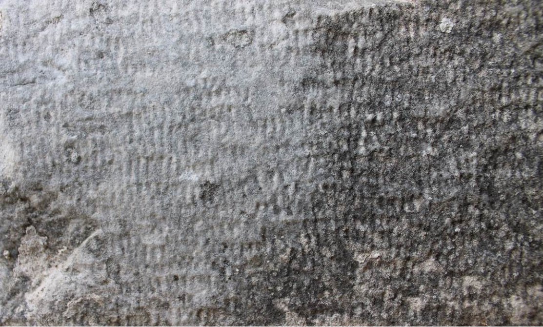
Εικ. Β4 Όψη κατεργασμένης επιφάνειας κατώφλιου από γκριζωπό μάρμαρο στη θύρα της αίθουσας προσευχής (εξωτερική όψη πλαισίου).